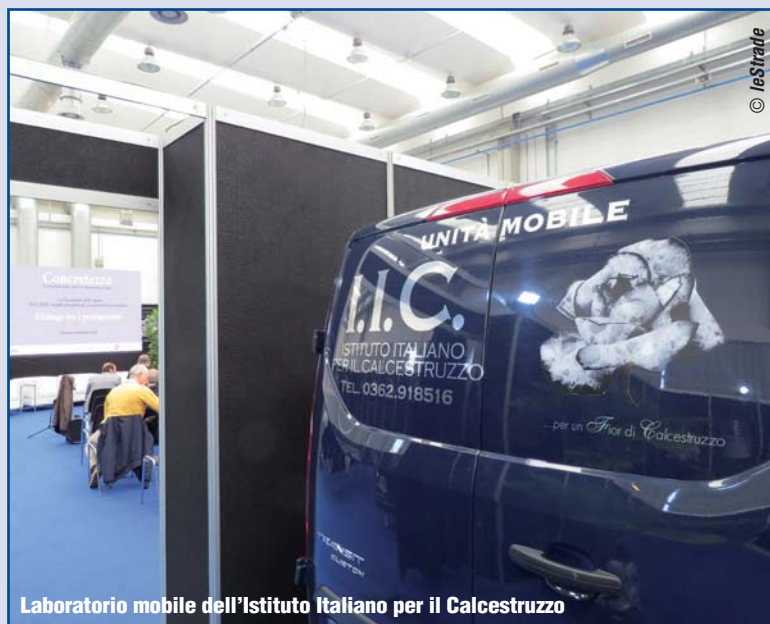
Laboratorio mobile dell'Istituto Italiano per il Calcestruzzo