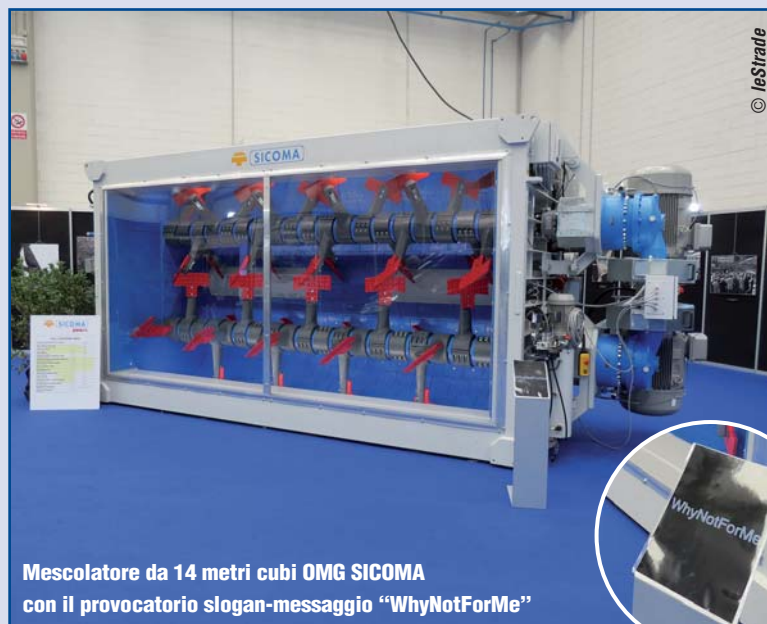
Mescolatore da 14 metri cubi OMG SICOMA con il provocatorio slogan-messaggio "WhyNotForMe"