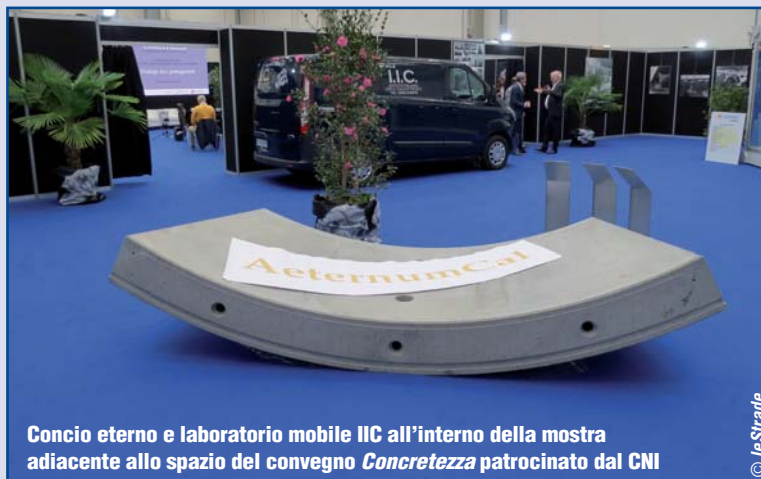
Concio eterno e laboratorio mobile IIC all'interno della mostra adiacente allo spazio del convegno Concretezza patrocinato dal CNI